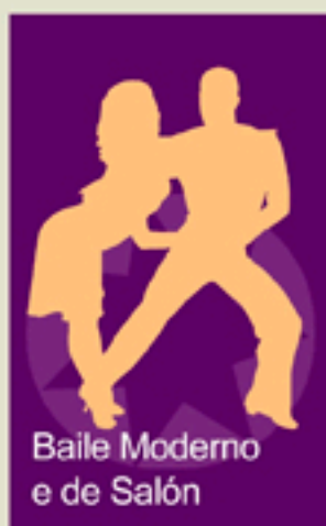
Baile Moderno e de Salón

2 h/semanais: Empadroados: 40 €/bimestre Non empadroados: 60 €/bimestre 1 h/semanal: Empadroados: 30€/bimestre No empadroados: 40 €/bimestre MAX 7 - MIN 5 inscritos por grupo