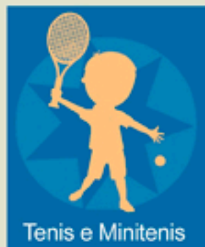
Tenis e Minitenis

2 h/semanais: Empadroados: 40 €/bimestre No empadroados: 60 €/bimestre 1 h/semanal: Empadroados: 30 €/bimestre No empadroados: 40 €/bimestre