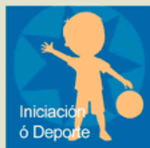
Iniciación ó Deporte

Ximnasia Rítmica + 4 anos Ximnasia Acrobática + 6 anos MARTES e XOVES de 16:30 a 17:30 h. Empadroados: 24 €/bimestre Non Empadroados: 40 €/bimestre